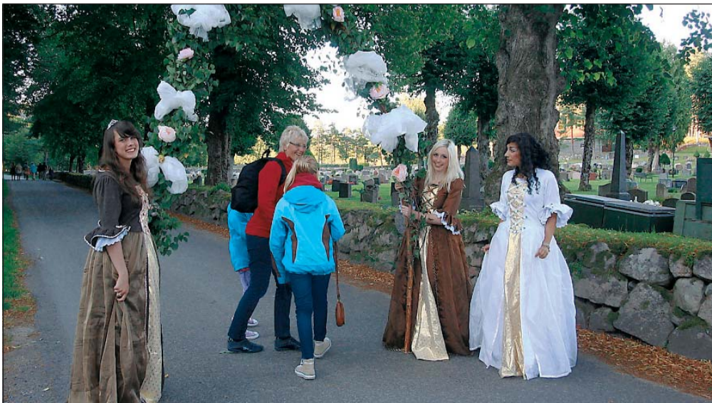
BLOMSTERPORTAL. Gjestene ble møtt av en blomsterportal utenfor Fjære kirke, som alle måtte gå gjennom. De ble ønsket velkommen til Steinbruddkveld.