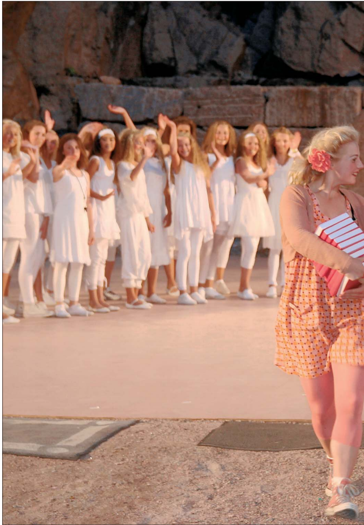
ET MAGISK TRE. Det var flinge, unge dansere som var med i «Det magiske treet» i Fjæreheia torsdag kveld.