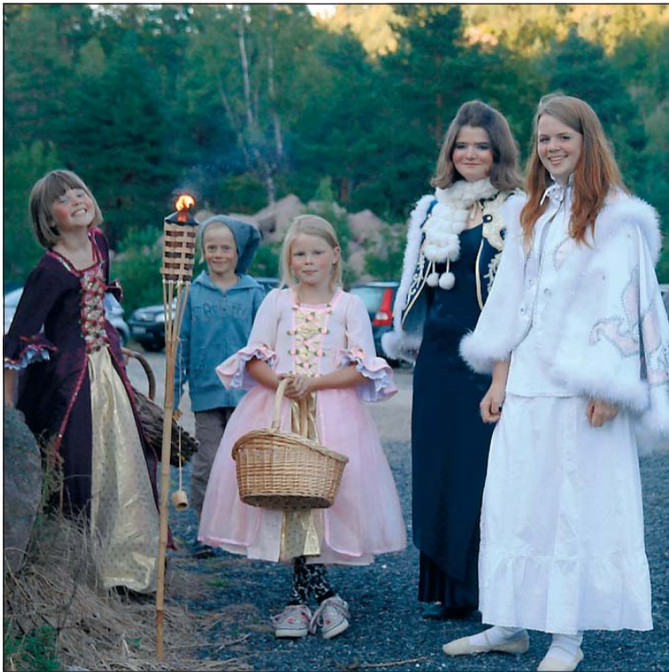
GODTERI. En flott pyntet gjeng delte ut kjærlighet på pinne fra kurvene sine.

Mange unge dansere som imponerte og underholdt i Fjæreheia torsdag,