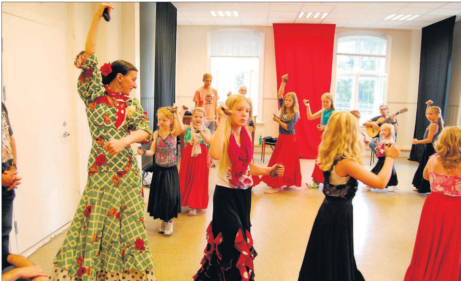
POPULÆRT. Barnas verdensdag var et svært populært arrangement i fjor. Dette skjer i år andre helgen i oktober. Førstkommende lørdag er dansende på kulturskolen.